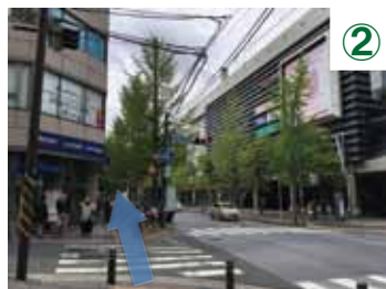
青葉台駅改札を出て左前方向にある西口を出ます。