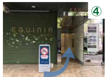
みずほ銀行の前を通りそのまま道沿いに進むと、隣に薬局「Tomos」と「TSUTAYA」が入ったビルがあります（エキニア青葉台ビル）。