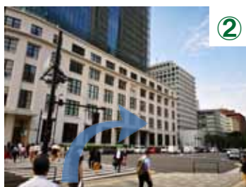
② JPタワー (KITTE) へむかう横断歩道を渡って右に進み、そのまま直進してください。