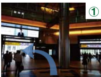
① 東京駅南口改札を出たら、東京国際フォーラム方面 (左方向) から外へ出てください。