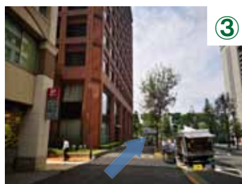
③ 日比谷通りにぶつかるまで直進してください。